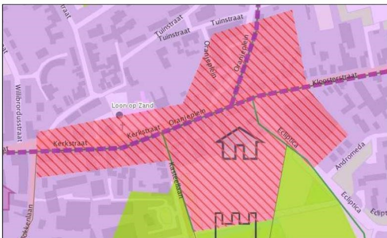
Centrumgebied kern Loon op Zand in rood gearceerd weergegeven.

Nadat we weten om welk gebied het gaat, willen we graag weten wat voor soort B&B u wilt beginnen. Een B&B in een bijgebouw of in uw eigen woning. Vervolgens stellen we een aantal vragen, bijvoorbeeld over het aantal bedden en over parkeren. Bij het parkeren is het belangrijk dat er in principe op eigen terrein geparkeerd moet kunnen worden. De parkeerplaatsen dienen naast elkaar te liggen. Achter elkaar parkeren is niet toegestaan. Alleen als de parkeerdruk in de omgeving het toelaat, kan worden afgeweken van de parkeervoorwaarde.