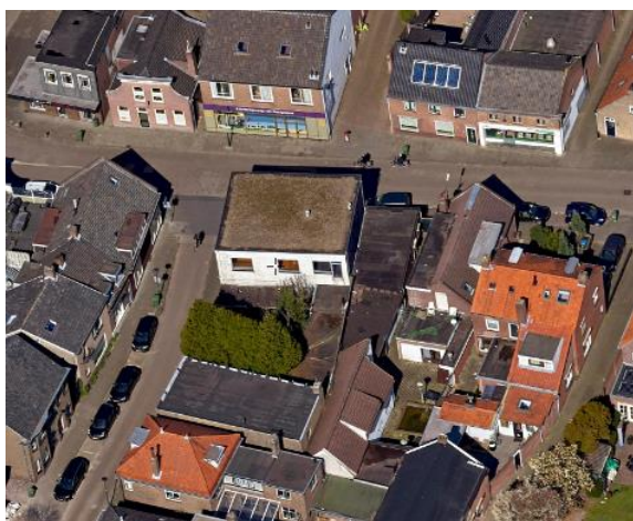
Luchtfoto Hoofdstraat 16-18

De digitale versie is juridisch bindend.